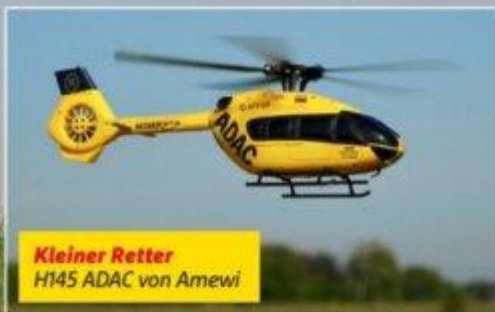
Kleiner Retter H145 ADAC von Amewi

Akro-IMAC Deutschland – Rückblick 2024, Ausblick 2025